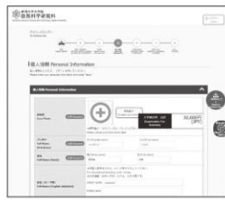
⑤ 個人情報(氏名・住所等)の 入力