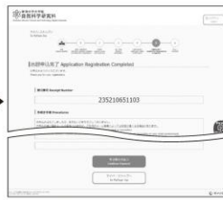
⑦ 申込登録完了 「引き続き支払う」ボタンを クリックし検定料のお支払い画面へ。