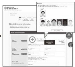
④ 顔写真のアップロード 「写真選択へ」ボタンをクリックし 写真を選択します。