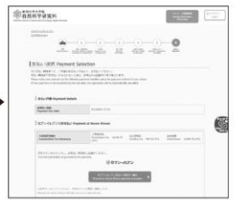
⑧ 入学検定料の支払い方法の選択 ● クレジットカード ● コンビニエンスストア ● ペイジー対応銀行ATM ● ネットバンキング ● Flywire ※ 進学者選考をのぞく