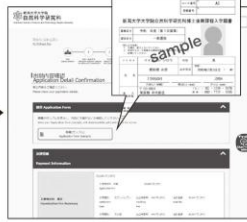
⑥ 出願内容の確認 「願書(サンプル)」ボタンを クリックすると志願票が確認できます。