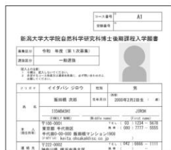
⑨ 出願に必要な書類PDFの印刷 (イメージ)