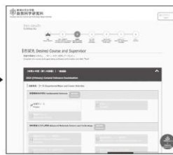
③ 志望専攻等の選択