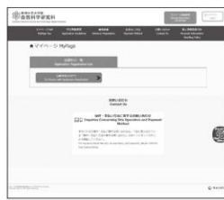
① マイページログイン後の 「出願手続きを行う」ボタン から登録画面へ