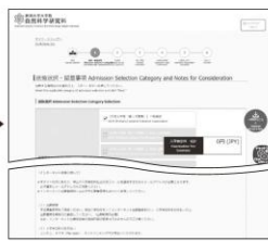
② 課程及び選抜の選択と 留意事項の確認