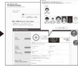
④ 顔写真のアップロード 写真選択へ ボタンをクリックし 写真を選択します。