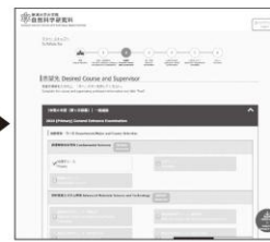
③ 志望専攻等の選択