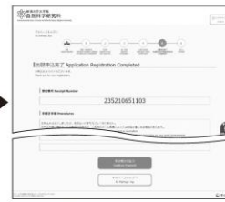
⑦ 申込登録完了 引き続き支払う ボタンを クリックし検定料のお支払い画面へ。