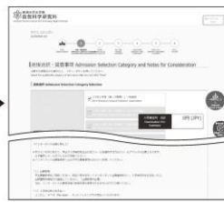
② 課程及び選抜の選択と 留意事項の確認