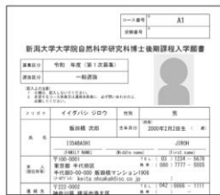
⑨ 出願に必要な書類PDFの印刷 (イメージ) ※ 検定料納入後に出力可能となります。

入学検定料の支払い方法で「コンビニエンスストア」または「ペイジー対応銀行ATM」を選択された方は、支払い方法の選択後に表示されるお支払いに必要な番号を下記メモ欄に控えたうえ、通知された「お支払い期限」内にコンビニエンスストアまたはペイジー対応銀行ATMにてお支払いください。