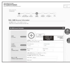
⑤ 個人情報(氏名・住所等)の 入力