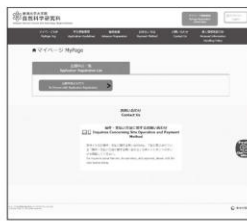
① マイページログイン後の 出願手続きを行う ボタン から登録画面へ