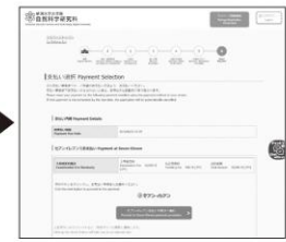
⑧ 入学検定料の支払い方法の選択 ● クレジットカード ● コンビニエンスストア ● ペイジー対応銀行ATM ● ネットバンキング ● Flywire ※ 進学者選考をのぞく