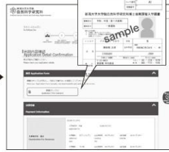
⑥ 出願内容の確認 願書(サンプル) ボタンを クリックすると志願票が確認できます。